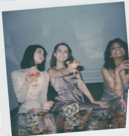
time with friends